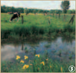
Zone humide, près de Marchiennes.

Sa forme particulière qui le fait ressembler, péjorativement à cette petite larve aquatique à la tête si développée, n'est évidemment pas