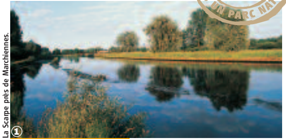
La Scarpe près de Marchiennes.

Randonnée VTT Circuit de l'Elpret : 17 km