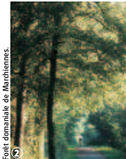
Forêt domaniale de Marchiennes.

Balilage jaune n° 7 Carte IGN : 2605 Ouest