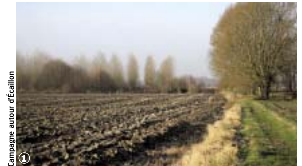
Campagne autour d'Ecaillon