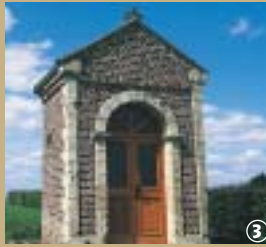
3 Chapelle en Ostrevant

Vous avez déjà sans doute entendu parler du bassin minier de l'Ostrevant mais connaissez-vous vraiment ses origines ? Il y a bien longtemps, environ 3000 ans avant notre ère, a eu lieu la « révolution » néolithique, caractérisée essentiellement par la fin du nomadisme et l'apparition d'élevage et de culture, vraisemblablement à l'initiative des