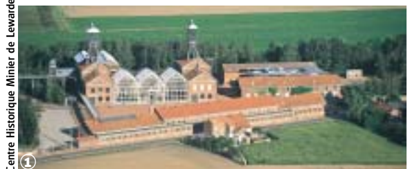
1 Centre Historique Minier de Lewarde

Abscon, Aniche, Auberchicourt, Bruille-lez-Marchiennes, Ecaillon, Emerchicourt, Erchin, Erre, Escaudain, Fenain, Hormaing, Lewarde, Monchecourt, Somain. 40 km