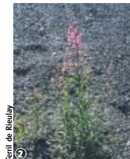
2 Terril de Rieulay