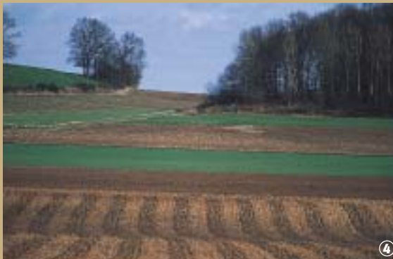
4 Plateau de l'Ostrevant

femmes. On assiste alors à la coexistence dans le Douaisis, de deux types de civilisations, les chasseurs, sur les plateaux et les cultivateurs, sur les plaines.